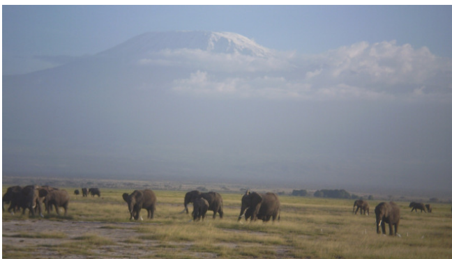
Amboseli Nationalpark mit dem Kilimandscharo

Der Hauptbahnhof ist mit allen öffentlichen Verkehrsmitteln sehr gut erreichbar. Von dort sind es wenige Minuten Fußweg zum Museum für Kunst und Gewerbe. Preise und Öffnungszeiten wie im Text angegeben. Bei weiteren Fragen: www.mkg-hamburg.de oder 040-428 134 999. Oliver Teetz